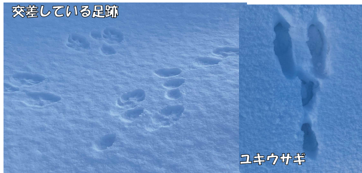
交差している足跡