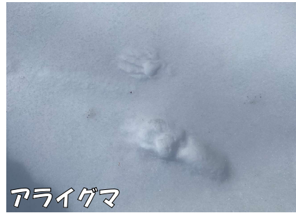
←小さい跡が前足で 大きい跡が後足

冬は姿は見えなくても、森に生活する生き物の痕跡がたくさん見られます。どんな足あとがだれのものか、照らし合わせてみてください。