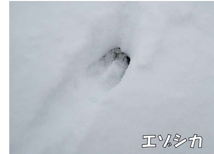
←ひづめの跡が 残ります