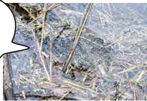
エゾアカガエルの卵塊