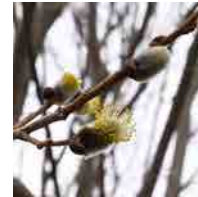
エゾノバッコヤナギ