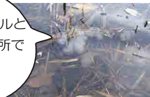
エゾサンショウウオの卵のう