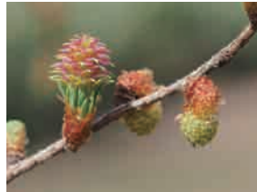
カラマツ▲(左:雌花、右:雄花)

◎エゾノキヌヤナギ ◎エゾノバッコヤナギ ◎オヒョウ ◎ナニワズ ◎ハルニレ オノエヤナギ カラマツ▲ キタコブシ シラカンバ ハンノキ ヤドリギ