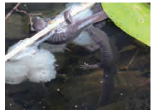
エゾサンショウウオ姿・卵