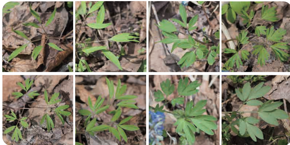
切れ込みがある細長い形