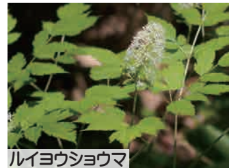
ルイヨウショウマ