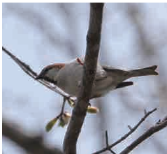
ニュウナイスズメ(左:雄、右:雌)