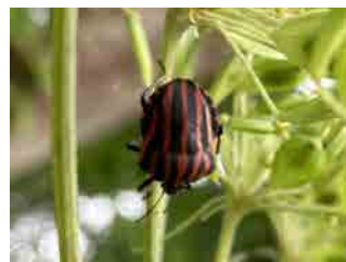
アカスジカメムシ