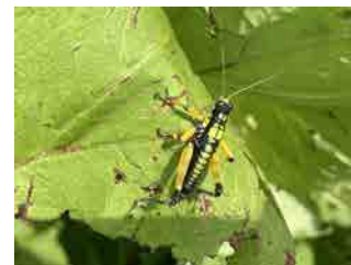
サッポロフキバッタ