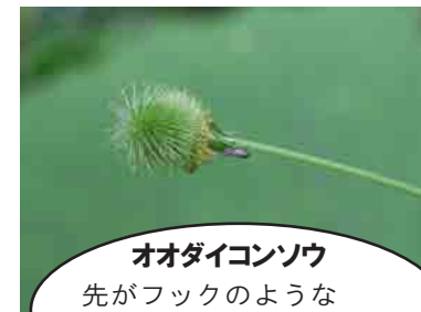
オオダイコンソウ 先がフックのような形状で、毛などにひっつく 茶色く熟す