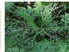
フキバッタが アキタブキを食べた跡

2001年5/8から作成してきた 森じょうほうは400号になりました! 第1号↓