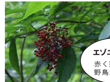
エゾニワトコ 赤く熟す 野鳥が食べる