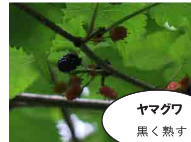
ヤマグワ 黒く熟す